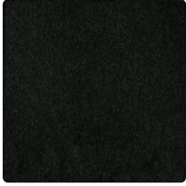
Schwarz Nr. 8007