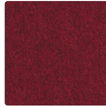
Rot-Schwarz Nr. 3004