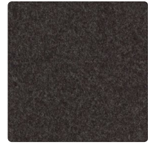
Schwarz Nr. 8005