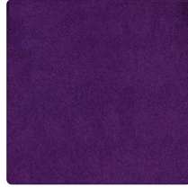
Violett Nr. 4004