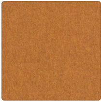
Orange-Gelb Nr. 2002