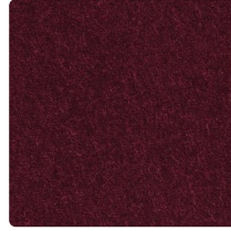
Violett-Dunkel Nr. 3001