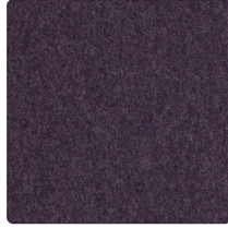
Schwarz-Blau Nr. 4003