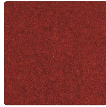
Rot-Braun Nr. 3002